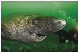
Íme a világ legöregebb cápjája - Videó