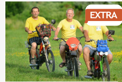
EXTRA Negyvennel is hasítanak a Babettákkal: a Földutas rali...