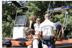
CSMRFK-nyereményjáték: a folyónak van egy olyan...