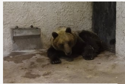
Nem született döntés az országot keresztül gyalogló maci...