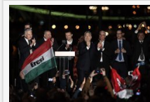
Orbán Viktor: "Győztünk!", Vona, az Együtt, az MSZP és az LMP elnöksége is lemond - 91 százalékon a feldolgozottság