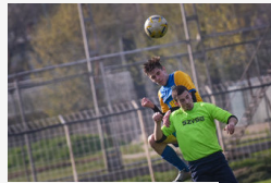
Nem hozott gólt a rangadó a SZVSE-pályán - fotók