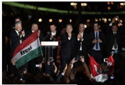
Orbán Viktor: "Győztünk!", Vona, az Együtt, az MSZP és...