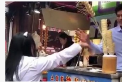
Kölcsön kenyér visszajár!