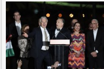
Reakciók - Orbán: Magyarország a bátor emberek országa