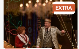
EXTRA Inkább elénekeljük: "Nehezen betűzgetnek az új cenzorok"...

CÍMOLDAL > SEGED HÍREI > IDÉN IS MEGRENDEZIK A SZENT-GYÖRGYI TANULMÁNYI VERSENYT SEGEDEN