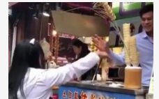
Kölcsön kenyér visszajár!