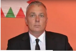
Visszautasítja a jobbikos jelölt rágalmait a Vásárhely24...