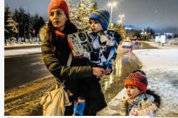
Ördög Nóra családi élete képernyőre kerül?