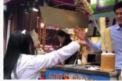
Kölcsön kenyér visszajár!