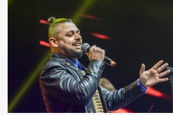
Veszélybe került Pápai Joci legféltebb kincse, a...