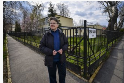
Egy órán át üvöltik világgá a diákok nevét: harsog a...