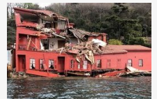
Ötvenmillió dolláros kár keletkezett a teherhajó által összezúzott török műemlékben