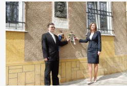
Turisták is látogatnak a sajtócézar miatt a...