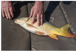
Ha el akarja vinni, meg kell ölnie - horgászt...