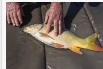
Ha el akarja vinni, meg kell ölnie - horgászt rabosítottak, mert tárogott a pontya a kocsijában