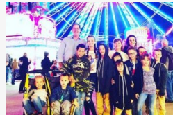
16 gyermeket nevel a szuperanyu - fotók