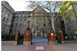
Családbarattá tennék a szegedi szülészetet