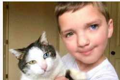
1600 kilométer egy barátért