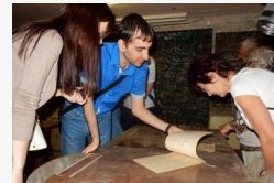
Hidegháborús bunker a makói fürdő mellett - Galéria