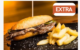
EXTRA Mi legyen a húsvéti maradékkal?

CÍMOLDAL > SEGED HÍREI > MEGSÉRTETTE AZ EGYETEM JÓ HÍRÉT, 340 EZRET KELL FIZETNIE