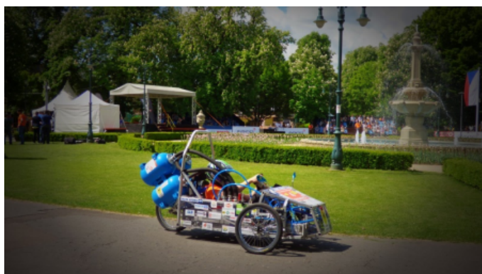
Az Airrari Szeged léghajtánya.

Ezek mellett a „Legjobb projektmanagement” különdíjjal jutalmazták az Airrari Szeged csapatot és a „Legötletesebb konstrukció” díjjal a Pepp-Air Team Szeged-et. Ilyen erős nemzetközi versenyben ezek az eredmények jól mutatják a Szegedi Tudományegyetem Mérnöki Kar szellemi potenciálját.