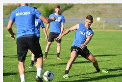
Mérhetővé vált a fizikai állapot a SZEOL-nál - fotók