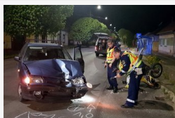
Súlyos motorosbaleset Mórahalmon