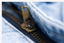
Szörnyű kórt kapott el szex útján - orvosi szerint nagy...