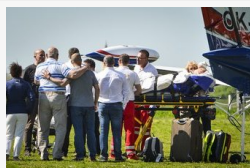
A szegedi klinikán kezelik tovább a Kubából...