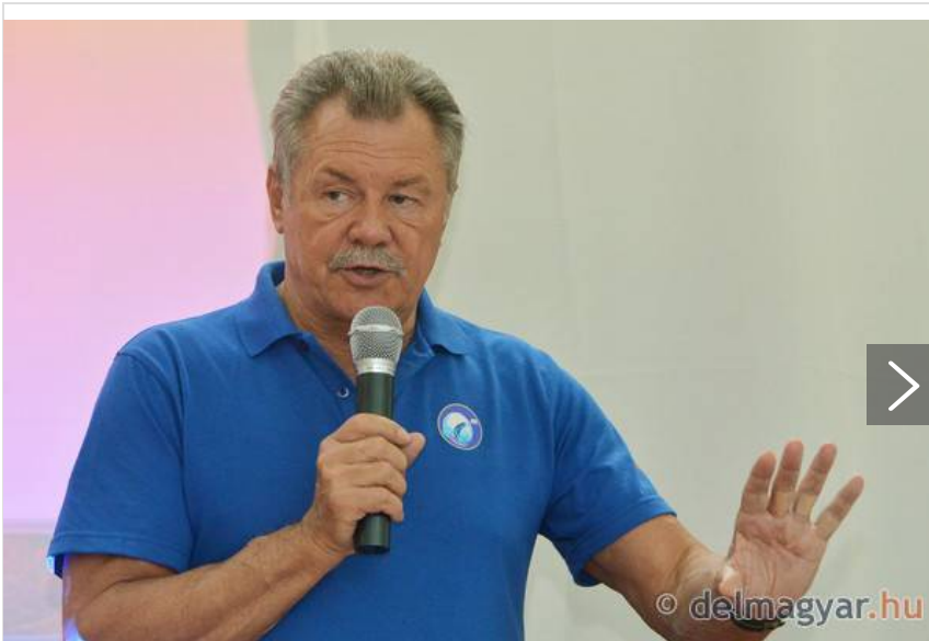
Farkas Bertalan Szegeden mesélt a világűrről.

A 4. a osztály előadással is készült, bemutatókat, plakátokat készítettek Farkas Bertalannak, aki 1980-ban a Szozuz-36 űrhajó fedélzetén ment a világűrbe. Az aláírások és fotók elkészítése után lapunknak elárulta, hogy már a keresztlánya is a repüléssel foglalkozik.