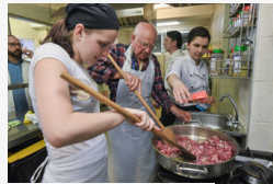
Párbeszéd az ízek nyelvén - idősothonban főztek a...