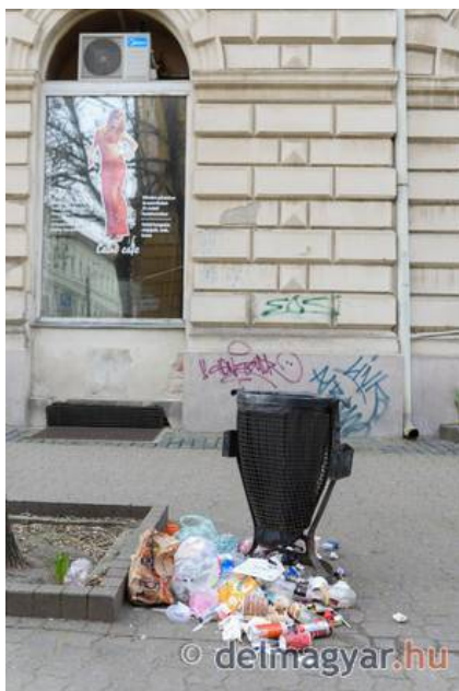
Nigériai diák késelt egy szegedi szórakozóhely előtt.

A másik esetben két csoport szólalkozott össze a Széchenyi téri City Music Pub előtt : egy férfi már távozása után, a kocsiból kiszállva visszament az utcán állókhoz és ököllel arcon ütött egy férfit. Erre a sértett mellett álló társa hasba szúrta őt. Az életveszélyt okozó testi sértés büntetvének megalapozott gyanúja miatt egy börtönőrt vettek őrizetbe.