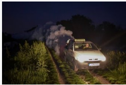
Füstöt lát Szegeden? Ne ijedjen meg, a szúnyogokra...