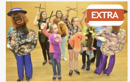
EXTRA Árnyékba bújva varázsolnak

CÍMOLDAL > SZEGED HÍREI > NIGÉRIAI DIÁK KÉSELT SZEGEDEN: A LAKÓK SZERINT VÁRHATÓ VOLT, HOGY ELŐBB-UTÓBB VALAMI TÖRTÉNIK