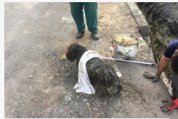
Panaszos nyűszítés az árokból: kutyát mentettek a...