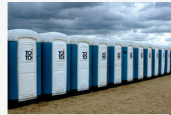
Búcsút mondhatunk a Toi Toi vécéknek