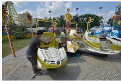
Pénteken indul a buli az Etelka soron: öt napig tart a...