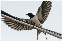
Itt délen késik a hidegfront: kora nyári öltözetet...