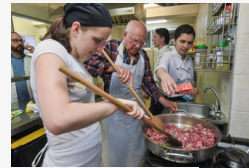
Párbeszéd az ízek nyelvén - idősothonban főztek a...