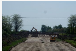
Bezárul a vásárhelyi környűrű - alapozzák a keleti...