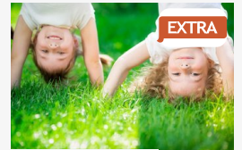
EXTRA A belső világunk tesz boldoggá - elkészült Magyarország...

CÍMOLDAL > SZEGED HÍREI > PÁR EZER FORINTOT HAGYTAK A VIRÁGOK HELYÉN: TÖVESTÜL ÉS SZÁLASTUL IS LOP A VIRÁGMAFFIA