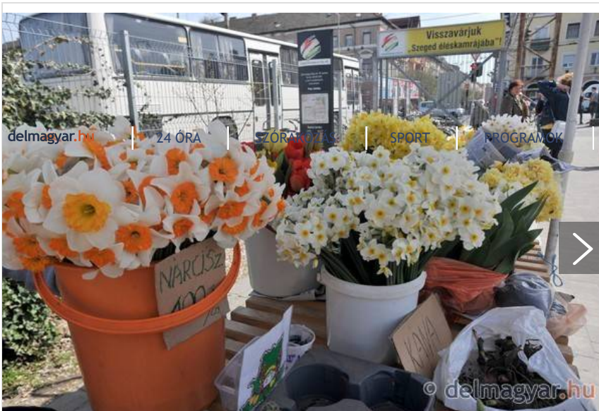
Tövestül és szálastul is lop a virágmaffia. (galéria)

– Volt, hogy kimentem a kertbe, a növényeimnek hűlt helye volt, de egyszer 5 ezer, egyszer pedig 4 ezer forintot találtam a helyükön. Nem tudom, hogy az illető a zsebéből rántotta ki, vagy ellenszolgáltatásnak szánta, de ugyanaz lehetett a besurranó, mert a pénz ugyanúgy volt összetekerve – mondta felháborodva olvasónk, aki éppúgy szereti az egyszerű krizantémot, mint a ritka, drágább növényeket. Volt, hogy még az ásáshoz használt spaklit is megtalálta a virágai helyén.