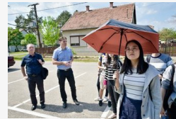
Bordánnyal ismerkedett tíz kínai joghallgató