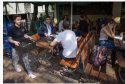
Csendrendelettől hangos a város - lázadnak és petíciót...