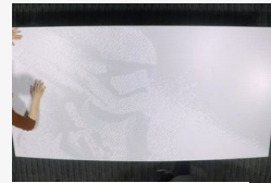
Ezt lehet megalkotni 28.800 rajzszőgből - videó