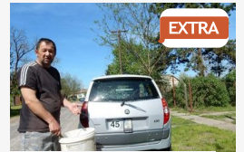
EXTRA Egy ideje már boltjuk is és falunapjuk is van

CÍMOLDAL > SZEGED HÍREI > EGY MEGOSZTOTT VILÁG TÖRTÉNETE: HIDEGHÁBORÚS IDŐUTAZÁS A TIK-BEN