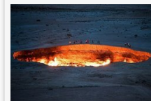
Létezik a pokol kapuja és Türkmenisztánban van - Videó