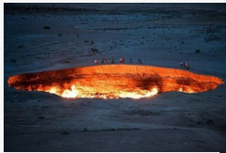
Létezik a pokol kapuja és Türkmenisztánban van - Videó