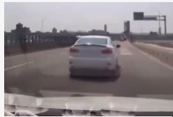
Hatalmas csellel előzte meg makacskodó autóstársát ez az...