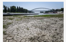
Eolvadt a sok hó a Tisza vízgyűjtőjén, már csak az eső hozhat árhullámot