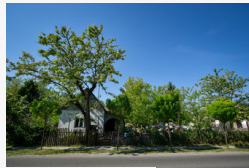
Nem bírnak a szemégyűjtő férfival: a hatóságok is...