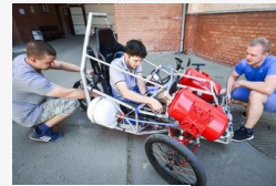
Három szegedi léghajtány is indul Egerben, szerelés...