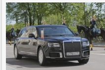
Bemutakozott az új orosz elnöki limuzin, a Szenat