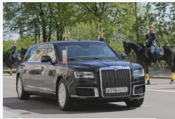
Bemutakozott az új orosz elnöki limuzin, a Szenat