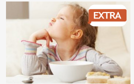
EXTRA A sok tiltás engedetlenséget szül - A túlzott...

CÍMOLDAL > SZEGED HÍREI > GYÓGYÍTSON AZ ÁPOLÓ AZ ORVOS HELYETT?