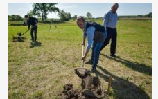
122 millió forintos fejlesztés kezdődött Pusztaszer szélén - December közepére épül fel a templom