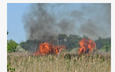
Ég a nádas a Bika-tónál