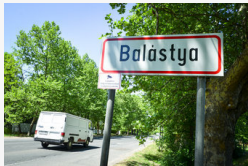
Kábítószer végzett egy 5 hónapos babával Balástyán -...