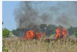
Ég a nádas a Bika-tónál