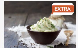
EXTRA Receptár - A sokoldalú karalábé

CÍMOLDAL > SZEGED HÍREI > HELYI VÉDETTSÉGET KAPOTT A GYERMEKKÓRHÁZ ÉPÜLETE