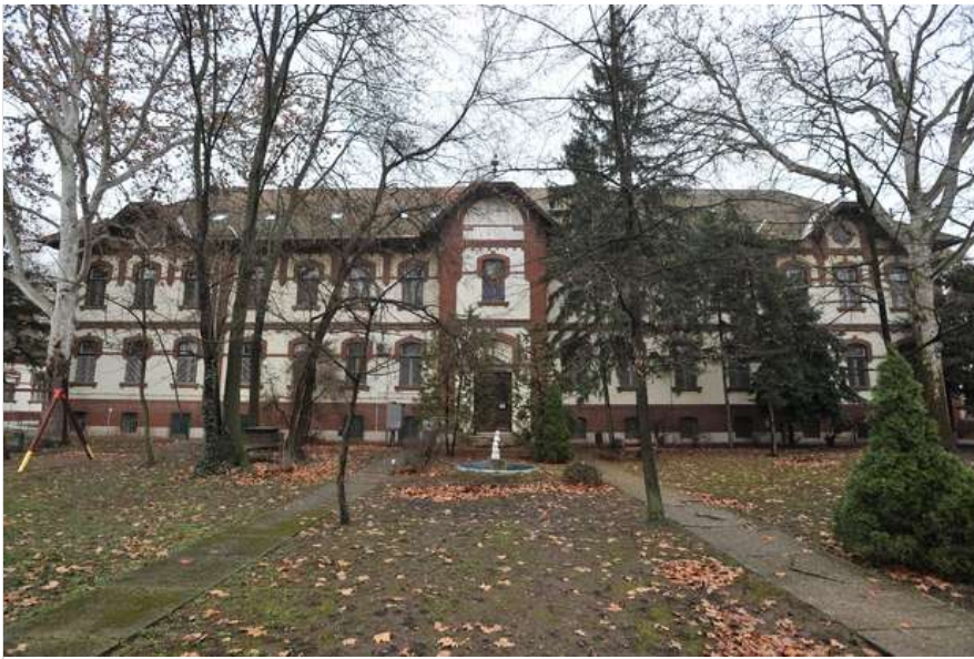
A védett épület megjelenését nem szabad megváltoztatni.