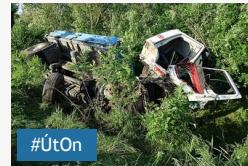
ÚtON: villamos és busz ütközött a Kossuth Lajos...