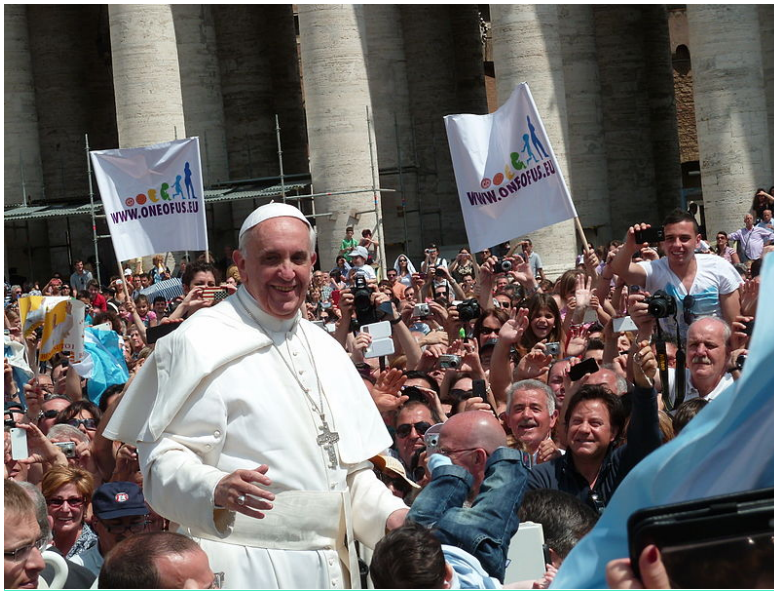
I. János Pál pápa óta

Ferenc pápa az első, aki korábban nem használt pápai nevet választott. Akárcsak a ferences rend alapítója, ő is a szegények, a béke és a teremtett világ érdekében emeli fel hangját, vagyis olyan egyházat szeretne, ahol az örömhír a legfontosabb. Buenos Airesben már megválasztásának hírére is meglepődve fogadták, intézkedései és modern szemléletmódja pedig a Vatikánban is megosztja a bíborosokat. De kicsoda valójában Ferenc pápa, akit ugyanabban az évben az Év emberének választott a Time magazin és egy melegeknek szóló amerikai lap, a The Advocate?