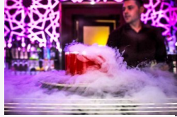
Másfél év alatt jutott a csúcsra a Híd utcai...