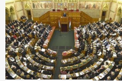
Megalakult az új országgyűlés