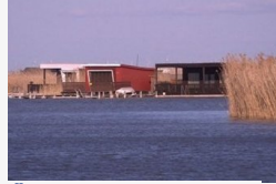
Ő a Fertő-tóban talált magyar prostituált gyilkosa -...