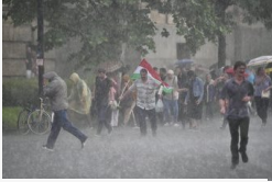
Ismét a demokráciáért tüntettek Budapesten, jégeső...