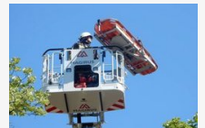
Az egyenruhások összehangoltan, precízen dolgoztak - Magasból mentés a makói főtéren