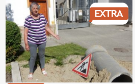
EXTRA Fedett csatorna helyett nyitott - a bűztől szellőztetni...

CÍMOLDAL > SZEGED HÍREI > GYILKOSSÁG A NÉGYLÉPCSŐSBEN: VOLT BIZTONSÁGI KAMERA, DE NEM RÖGZÍTETTE AZ EMBERÖLÉST