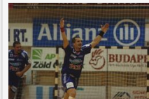
Május 12. egy szép Pick-emlék: 11 éve ezen a napon nyert a bajnoki döntőben a Szeged