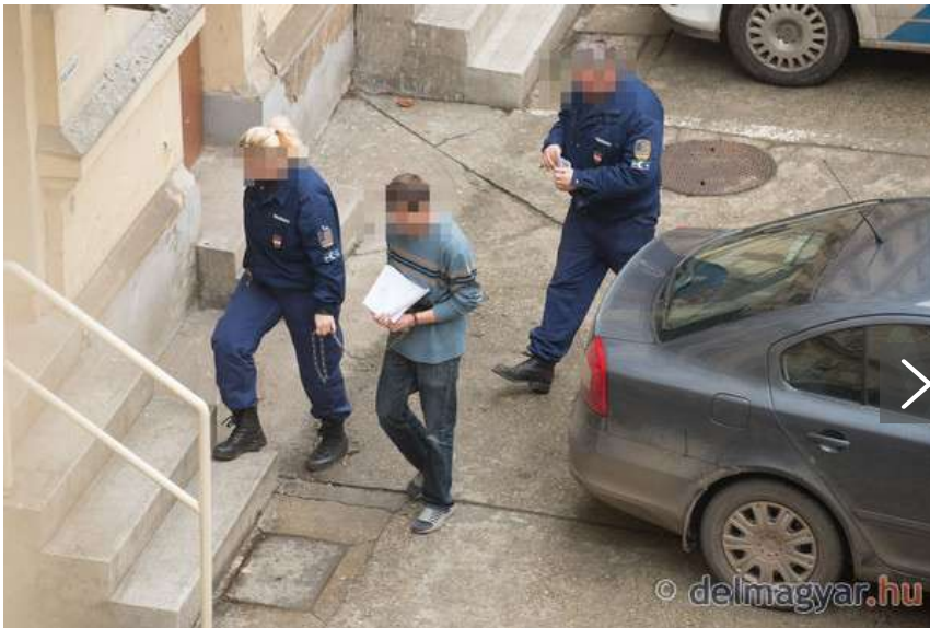
Gyilkosság a sörözőben: jogos védelmi helyzetre hivatkozik N. Bence.

– Másfél-két évig dolgozott nálam segéd munkásként az építőiparban. A légynek se tudott volna ártani. Olyan ember volt, akit az asztalomhoz is odaengedtem volna – mesélte volt munkaadója az áldozatról. B. Dánieltől közösségi oldalán búcsúznak barátai és ismerősei. Ebből kiderült, hogy a férfi másfél éve élt együtt egy nővel, aki bejegyzései szerint rendkívül összetört a tragédia miatt. Szerelmétől a Children of Distance együttes Hozd vissza című számával búcsúzott.