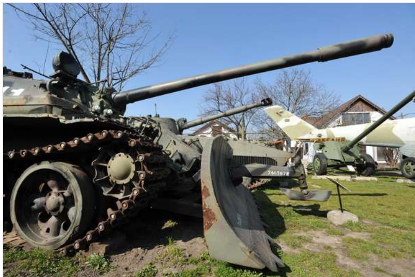
Csendélet a szegedi hadiparkban. Itt is láthatnak harcjárműveket a hallgatók.

A honvédelmi kurzus tematikájában szerepel egyebek mellett a jogszabályi ismeretek, a szabályozás szintjei, nemzetközi hadi jogi ismeretek, valamint a hallgatók megismerkednek általánosságban hazánk honvédelmi rendszerével, annak felépítésével és a honvédelem központi irányításával. Az óradók Pécsről, illetve Budapestről jönnek.