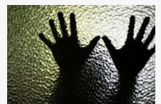
Negyven nőt erőszakolt meg az 57 éves családapa