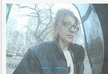
Más pénzére vágyott, most a rendőrség keresi - fotók