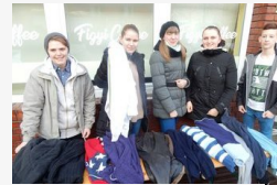
A nagy hidegben több helyen lehet melegedni: ...