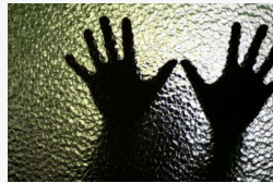
Negyven nőt erőszakolt meg az 57 éves családapa