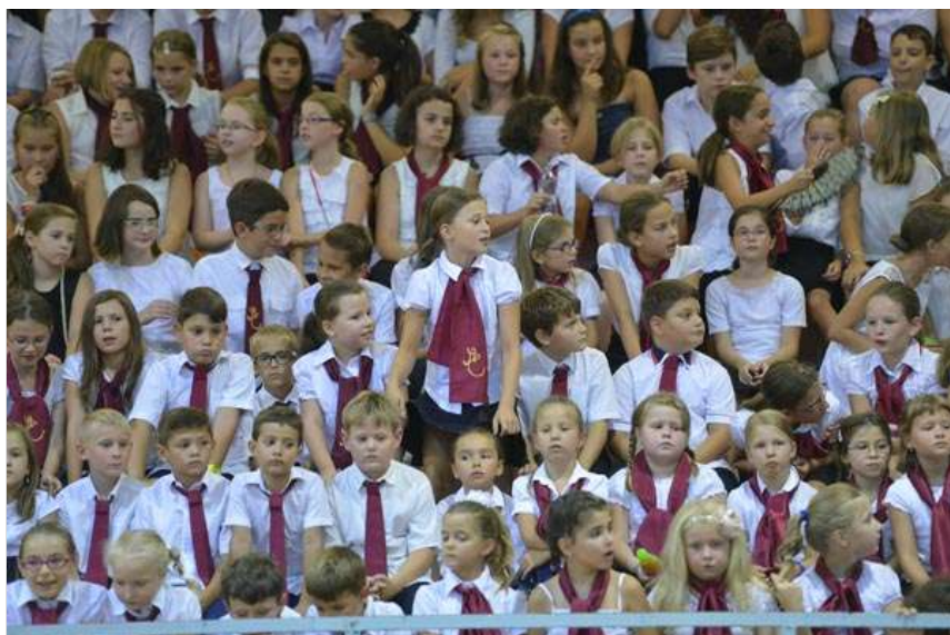
Sok kisdíák bordó kendővel. Régi monogrammal és anélkül.

– Mivel már nem Ságváriak hívják az iskolát, azt gondoltam, nincs már szükség az SE feliratos nyakkendőre – magyarázta egy anyuka, miért nem viseli kislánya az összetartozás jelképét. A legtöbben azonban gondolkodás nélkül felvették a bordó kiegészítőt, és mint kiderült, nem is kell elbúcsúzni tőle. Az elsősök azonban már olyan kendőket kaptak, amelyeken nem szerepel a jellegzetes monogram.