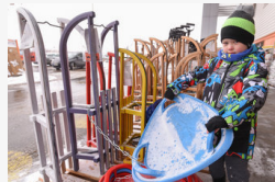
Vitték a szánkót, mint a cukrot - A napfény városában...