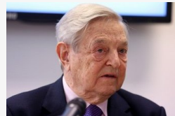
Kiszivárgott a Soros-féle kvótapaktum