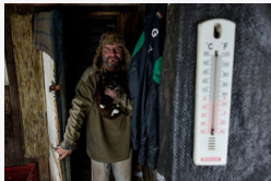
Rettegnek a hidegtől: a kiskertekben élők közül sokaknak...