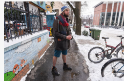
Szórós lába melegíti a télen is rövidnadrágban járó...