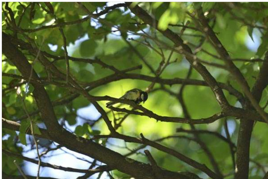
Lombok között egy széncinege.

A parti-, a molnár-, a füst- és a sarlósfecske is eredetileg sziklalakó volt. A városokban, így Szegeden is a házak eresze alatt költenek, illetve a sarlósfecske a tarjáni panelek réseibe is fészkel. Németország északi részén még láttam sziklarepedésekben fészkelő sarlósfecskét. De nagy részük mára beszkokott a falvakba, városokba, templomtornyok réseibe, és csoportosan költenek.