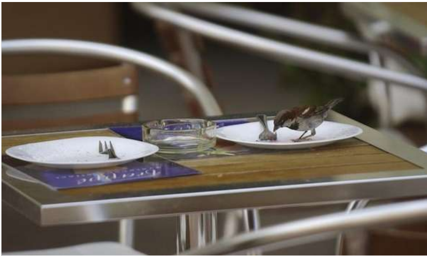
A szegedi Kárász utcán lévő asztalon urbanizált házi veréb tálalva.