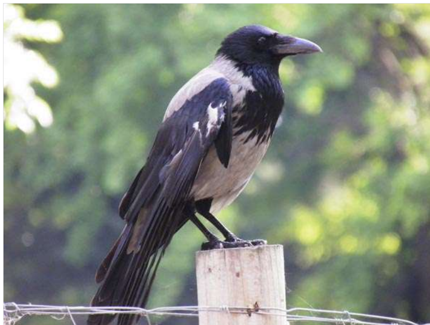
Egy dinamikus dolmányos varjú.

- Azt gondoljuk, hogy azért jelentek meg a városban, mert biztonságban érzik magukat. Ugyan ez már tilos, de annak idején a vadászok tavasszal dúvadirtást tartottak. Ilyenkor a szarkát és a dolmányos varjút ritkították úgy, hogy belelőttek a madarak fészkeibe. És mivel a baglyok gyakran beköltöztek ezekbe, így ők is áldozatul estek. Talán biztonságérzetet ad a bagolynak, hogy nincsen lövöldözés a városban. Egyébként Makón is egy háznak az erkélyére költött az erdei fülesbagoly, mint ahogy Szegeden Tarjánban két esetet is ismerünk - tudjuk meg. Továbbá, mivel a Széchenyi téri platánfák több mint százévesek, a madarak szeretik a hatalmas lombkoronájukat, a fatörzsek tele vannak odúkkal.