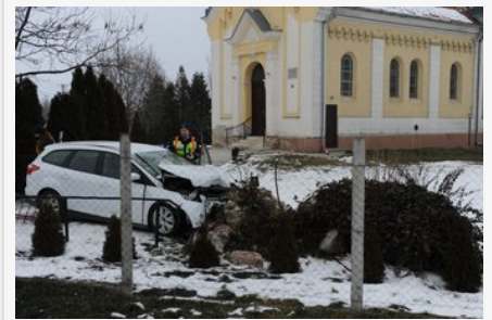
Templomudvarba hajtott egy autó Enesén: megsérült három gyermek a járműben, a sofőrt keresik - újabb részletek, fotók

– Amikor elkezdődött a kisajátítás, javasoltam a Kiskunsági Nemzeti Parknak, hogy a 130 hektár legelő helyett csereként biztosítsanak 130 hektárnyi szántót