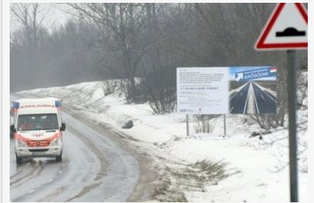
M85-ös útépítés - Alapkőletétel szerdán Sopronnál - Lezárták a Petőfi téri mélygarázst Sopronban