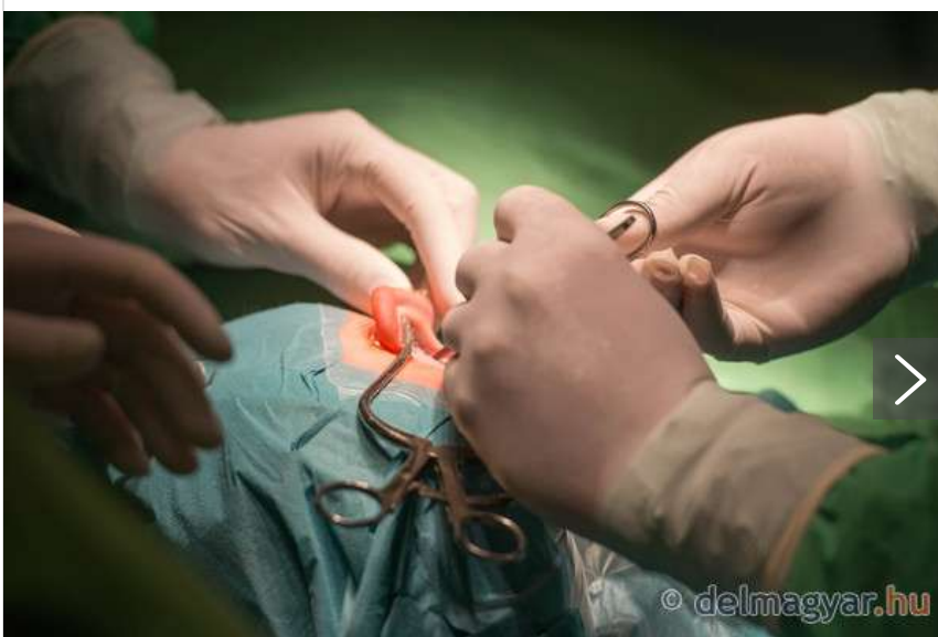
A 400. implantátumbeültetés Szegede. (galéria)

beszélni, annak az implantátum bármelyik életkorban visszaadhatja a teljes értékű életet. Az eddigi négyezer operált közül 45-en már felnőttek voltak.