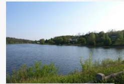
Tragédia: a Döröskei tóba fulladt az Őrségi Nemzeti Park...