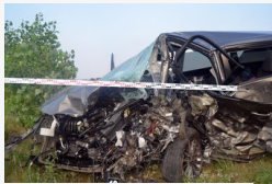
Halálos baleset az 55-ösön: frontálisan ütközött két...