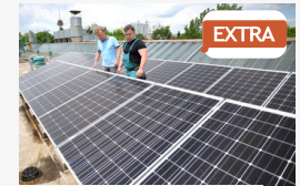
EXTRA 600 napelem segíti a szegedi távfűtést

CÍMOLDAL > SZEGED HÍREI > 2016-BAN ÉRKEZNEK A LÉZEREK - FEKETÉBE BORUL AZ ELI