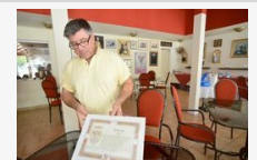
Santo elfáradt, nem akar Don Quijote lenni: eladó a Pelikán Hotel, de nem mindenáron