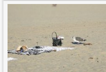
A "lopásgátló" törölköző semmit sem ér - így vigyázzon értékeire nyaraláskor - játsszon a CSMRFK nyerevényeiért!