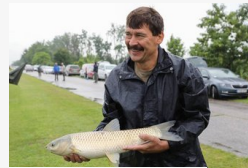
Amurt fogott Áder János a Maty-éren