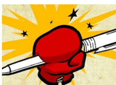
Tóta W.: Száll egy pofon a szélben