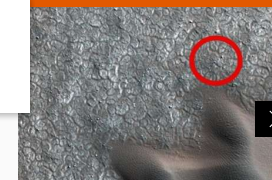
Elképesztő kép készült a Marsról, és van rajta egy izgalmas ...