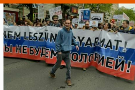
Békemenetre békemenettel válaszol a Kutyaapárt