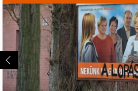
Újabb felmérés: 300 ezer szavazó hagyta ott a Fideszt