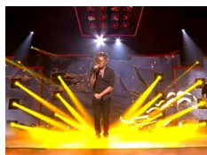
Az AWS nyerte A Dalt, ők fogják képviselni hazánkat az Eurovízió