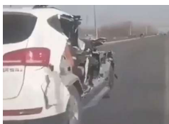
Az autó fele hiányzott, de simán elfurikáztak vele az úton – videó