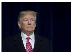
Trump aláírta az importvámról szóló rendeletet