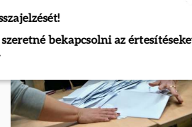
Bejött az összefogas: az ellenzék legyőzte a Fideszt Hódmező...