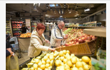
Rutinosan vásárolt a domaszéki házaspár: Pintérek is nyertek Telekosár játékunkon