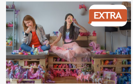
EXTRA Rózsaszín pónilovak hívnak varrószeánszra: vagány dolog...

CÍMOLDAL > SZTE - SZEGEDI TUDOMÁNYEGYETEM > NEMZETKÖZIESÍTÉS AZ EGYETEMEK ZÁSZLAJÁN