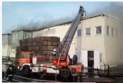
Égnek a gyökerek Makón: 1000 négyzetméteres raktár...