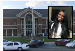
Kétszer lőtt véletlenül: egy tinilány halálát okozta és...