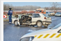
Baleset Mórahalom és Ásotthalom között, három ember megsérült - fotógalleria