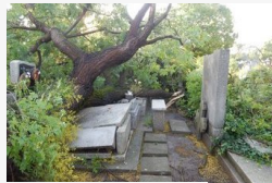
Óriási fák dőltek, összetörték a sírok: a makó-belvárosi...