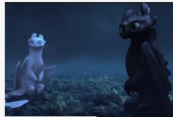
Így neveld a sárkányodat 3 - itt a magyar nyelvű...