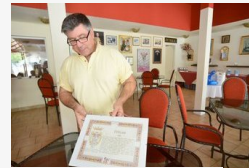
Santo elfáradt, nem akar Don Quijote lenni: eladó a...