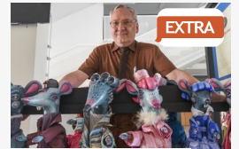
EXTRA Ahány báb, annyi történet

CÍMOLDAL > SZEGED HÍREI > NEMZETKÖZI FÖLDRAJZVERSENY SZEGEDEN, A 28 LEGJOBB CSAPATTAL