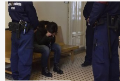
Terrorizmus finanszírozásával gyanúsítják a Röszkén...