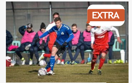
EXTRA Hónapokat vártak a sikerre: a Szeged 2011 támadója, ...

CÍMOLDAL > SZEGED HÍREI > FRANK: FELESLEGES AZ ÓVATOSSÁG SÁGVÁRI-ÜGYBEN