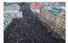
Tízezren tüntettek Pozsonyban Fico és kormánya ellen - Fotók