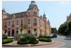
Kormányzati ígéretet kapott Szentes a Petőfi Szálló...