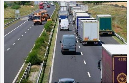
Szombaton is folytatódnak az M1-es autópálya burkolatjavítási munkái