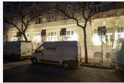
Reklámfilmet forgatott Szegeden az OTP - fotók