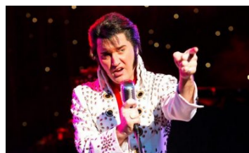
Elvis él, és Szegedre is ellátogat!