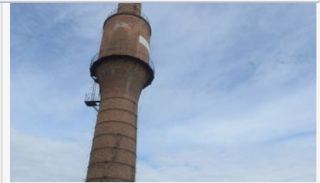
Felrobbantják Győrben a 107 éves kéményt

- Az amerikaiak family practice-nek hívják ezt a képzést, de nálunk ezt nem lehetett így fordítani, hiszen jól működő körzeti gyermekorvosi rendszerünk volt. Ha a gyerekeket ők látják el, nem hívhatjuk a többieket családorvosnak. Ezért vettük át a német Hausarzt fordítását, és lettek háziiorvosok. Az oktatásban azonban mindkét rész benne van, ezért nevezzük azt családorvosi intézetnek.