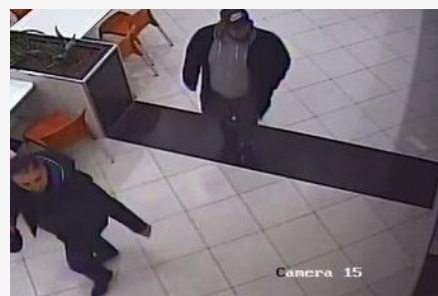
Székre akasztott kabátból lopott pénzt két férfi Győrben - Felismeri a tolvajokat?