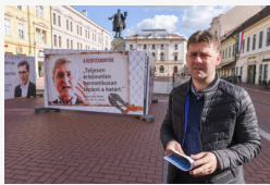
Plakátháború a Klauzál téren: a szocialisták molinókkal...