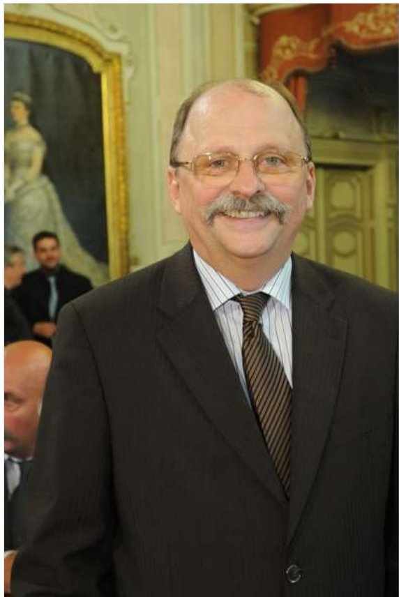
Ormos Pál.

MTA levelező, majd 2004-ben rendes tagjává választották. 2009 óta az Amerikai Fizikai Társaság választott tagja.