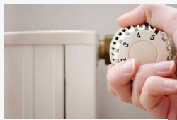
Áprilisban írják jóvá a 12 ezres támogatást a...