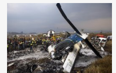
Ez okozhatta a katmandui légi szerencsétlenséget