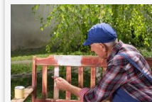
EXTRA 10 tipp a tavaszi karbantartáshoz