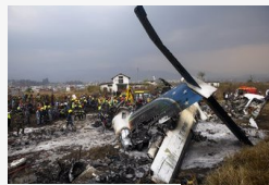
Ez okozhatta a katmandui légi szerencsétlenséget