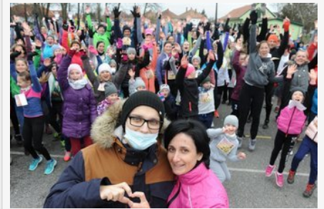
Megható: százak futottak a rákkal küzdő Roliért Enesén - fotók

Pétervári János rendőrőrmester belehalt a sérüléseibe. Palotás Ferenc csendőrnagyot 1949-ben első fokon halálra ítélte a bíróság, majd a fellebbezés után életfogytig tartó börtönre, majd 1959-ben halálra ítélték. Kristóf László csendőrnagyot kötél általi halálra ítélték. Cselényi (Zimmer) Antal külföldre menekült a háború végén, és 1971-ben, 68 évesen Kanadában halt meg. Kristóf Lászlót a Legfelsőbb Bíróság 2006. március 6-án rehabilitálta, hatályon kívül helyezte az ellene 1959-ben Ságvári meggyilkolásáért hozott halálos ítéletet. Palotás Ferenc ítéletének felülvizsgálati kérelméről nincs információ.