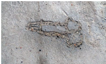
Betonba rajzolt farokkal sokkol a Délmagyar