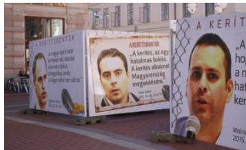
Kerítéstagadó politikusok a Klauzál téren – Szegedre érkezett a Fidelitas plakátkiállítása