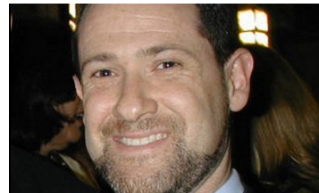
Amerikai diplomata tart előadást Szegeden