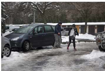
Életveszélyessé változnak reggelre a szegedi utak!