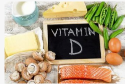
Veszélyes a D-vitamin hiány