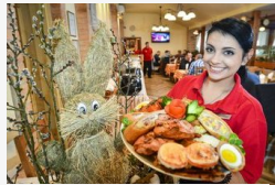
Ha nem muszáj, sokan inkább nem küzdenek otthon, a...