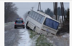
Árokba sodródott egy menetrend szerinti busz Tömörkénynél, térképen követhetik a hókotrókat - fotók