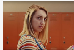
Milyen lenne tekintettel feloldani a telefont? - videó