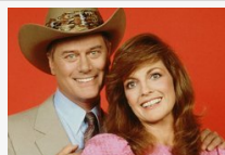
78 évesen is elképesztően jól néz ki a Dallas Samanthája - fotó