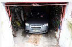
Ittasan ütötte el az idős nőt, otthagyta az autóbekjárn