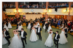
Eötvösösök szalagavató bálja a Deákban - óriásgaléria