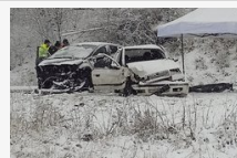
Frontális karambol, meghalt az egyik sérült - fotó