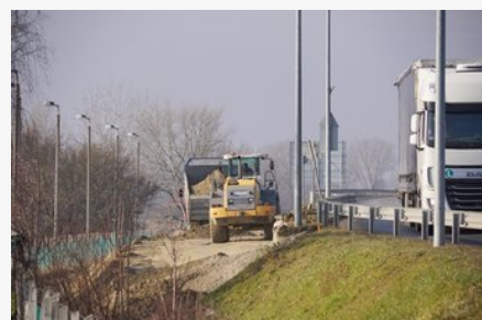
Énítik a "Badnóti utcai" kikötés