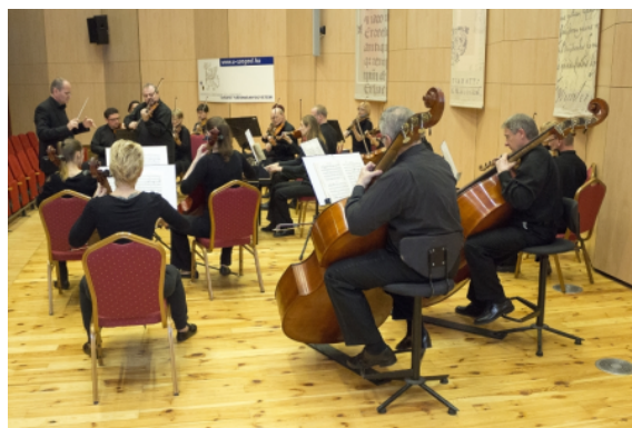
(/sztehirek/2014-december/10-eves-tik?galleryID=0) Tízéves a TIK: nemzetközi színvonalú intézmény - GALÉRIA/2

– Ez jót tett Szeged városának és az egyetemnek is, mert van egy olyan hely, ahol akár 5-600 fős, nagy kongresszusokat is lehet szervezni. Végül, de nem utolsósorban úgy érzem, hogy az ide beköltöző szervezetek – az egyetemi könyvtár, ami az ország legnagyobb és legjobb könyvtára, a HSYI, az egyetemi ajándékbolt és az egyetemi könyvesbolt – mind kellett ahhoz, hogy a TIK az egyetem központi helyévé váljon.