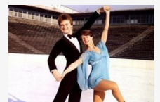
Az olimpiai ezüstérmes szerint itt lenne az ideje újabb magyar éremnek