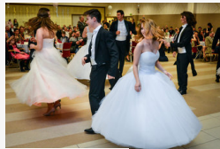
Waldorfosok szalagavató bálja az IH-ban - óriásgaléria