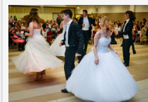
Waldorfosok szalagavató bálja az IH-ban - óriásgaléria