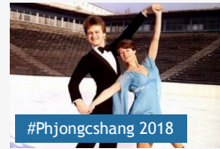
Az olimpiai ezüstérmes szerint itt lenne az ideje egy...