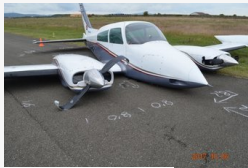
Légi közlekedés veszélyeztetése miatt emelhetnek vádat...