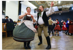
Először rendeztek népviseletes bált Szegeden - galéria