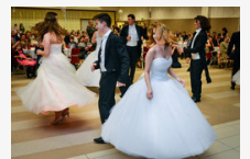
Waldorfosok szalagavató bálja az IH-ban - óriásgaléria