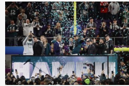
Őrült meccsen az Eagles nyerte a Super Bowl - New...