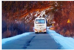
Durva - 1,6 tonna hóval a tetején közlekedett a busz...