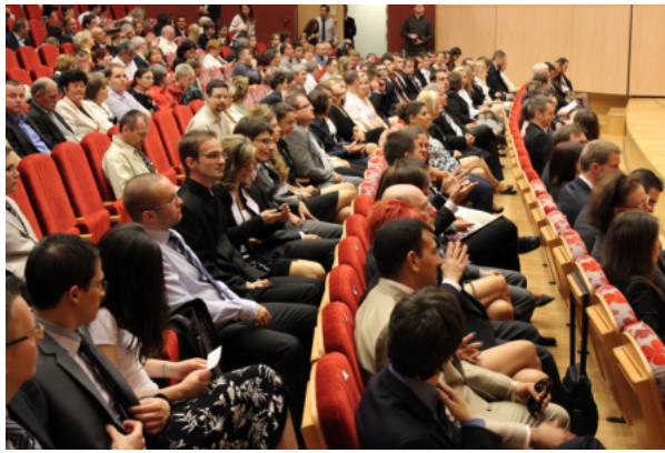
(/sztehirek/2014-junius/phd-doktori-atado-tik?galleryID=0) Több mint 100 PhD-doktort avattak a Szegedi Tudományegyetemen - GALÉRIA