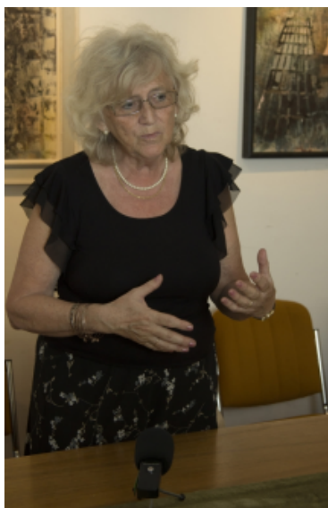
(/sztehirek/2014-junius/gyogypedagogiai-140620?galleryID=0) Gyógypedagógiai konferencia Szegeden - GALÉRIA