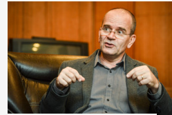
Az irány változatlan: legfőbb értéknek a színház...