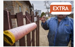
EXTRA Ahol a Google sem jár - kőválygás helyett inkább...

CÍMOLDAL > SZEGED HÍREI > NEM CSAK PÉNZBEN MÉRIK A HASZNOT