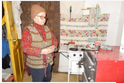
A makóiak nem értik, miért télen végzik az áramszünettel...