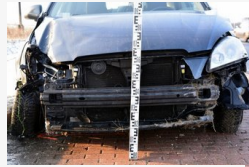
Elaludt a volánnál a 26 éves nő, az árokban kötött ki -...