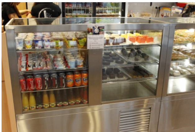
(/sztehirek/2014-szeptember/tik-kavezo-felujitasi?galleryID=0) Megújult a TIK Café - GALÉRIA