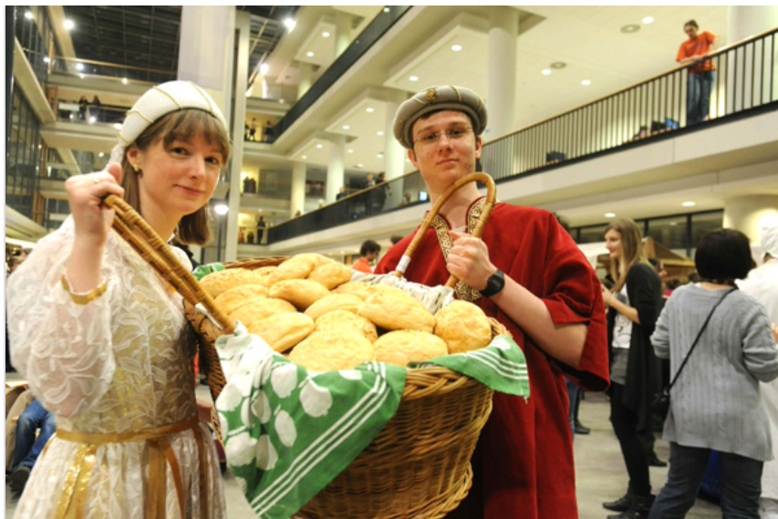
Aki megéhezt, az frissen sült cipóval lakhatott jól.

– Korhű XII. századi ruházatban, láncvértékkel jelenítünk meg egy várfalak között játszódó történetet – mondta Nagy Gábor, a lovagrend elnöke. Gobelinvarró műhely, kézműves-foglalkozás, boszorkánykonyha, középkori társasjáték és activity is várta a látogatókat – akik este 10-től, a „kegyelem óráiban” kedvezményt kaptak, ha a kölcsönzési határidő lejárta után hozták vissza könyveiket.