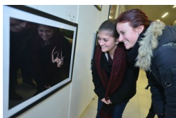
Természetfotók ifjú tehetségektől az Agórában