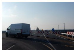
Az elkerülő út már kész, a környezetét szépítgetik: a...