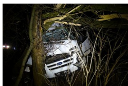
Fának csapódott egy autó Szentesnél