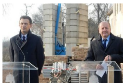
Honvédelmi sportközpont létesül Vásárhelyen - 2020-ra...