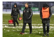
Félmillió pénzbüntetést kapott a Szeged 2011 korábbi edzője