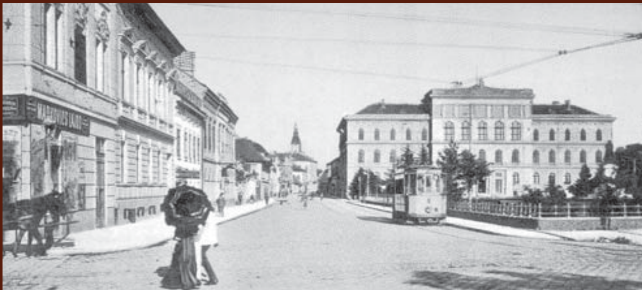
A kép 1921- ben készült a Dugonics téren

Alma Mater tagjaink az Egyetemi Könyvtár szolgáltatásait kedvezményes, 1000 Ft-os beiratkozási áron vehetik igénybe.