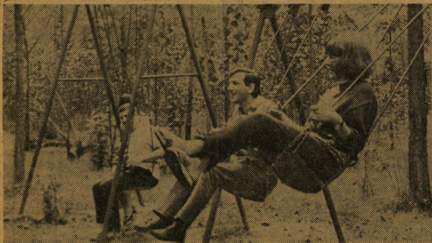
Játékban, vidámságban sincs hiány. Van labdarúgás, kézilabda, röplabda, ping-pong, s a gyermekibb lelkületűek számára — hinta is.