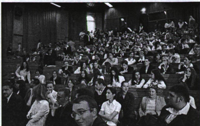
A bölcsészkar Auditorium Maximum nemcsak 1956-ban, hanem 1988-ban is a hallgatói közélet központja volt. E két eseményre a falon emléktábla hívja fel az utókor figyelmét.