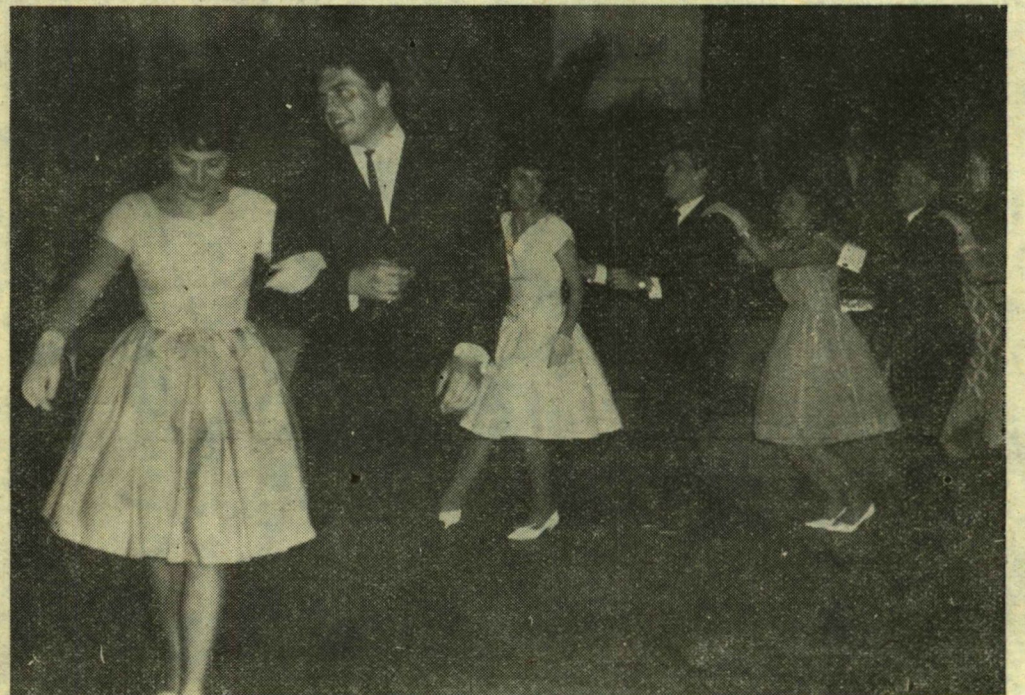
Igen jól sikerült a Szegedi Tanárképző Főiskola hagyományos tavaszt-köszöntő bálja a Hungária Szálló összes termeiben. A bált nyitó francia négyes után a kecskeméti Mercury-zenekar szolgáltatta kivilágos-kivirradatit, azaz hajnali 4 óráig a zenét a bálzóknak.