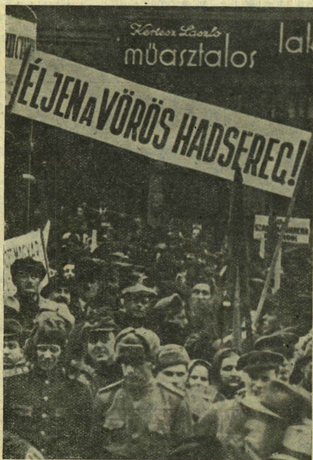
Szeged népe zászlókkal, transzparenszekkel ünnepelte huszonegy évvel ezelőtti hazánk felszabadulását. Emlék- és történelmi dokumentum a kép: Szovjet katonák és Szeged város mosolygó, fellélegzett lakossága egyképpen örül a napfénynek, a csendnek. Béke van. Elhallgattak a fegyverek.