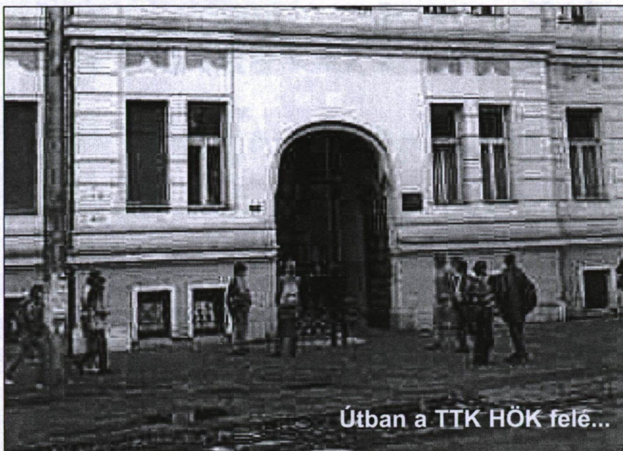
Útban a TTK HÖK felé...