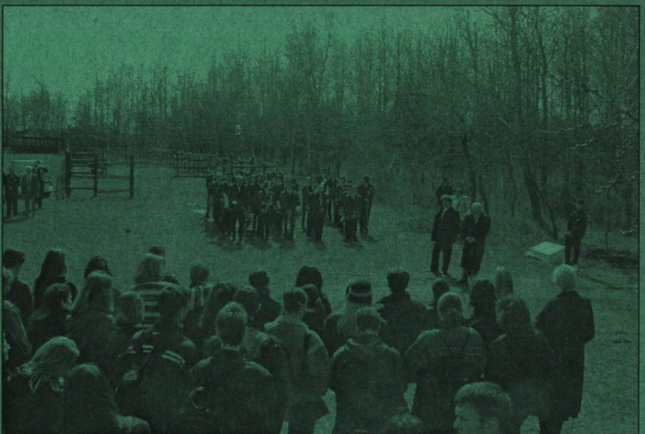
A megemlékezésen megjelent diákokat kisiskolások műsora, tűzoltózenekar és Jancsák ünnepi beszéde várta