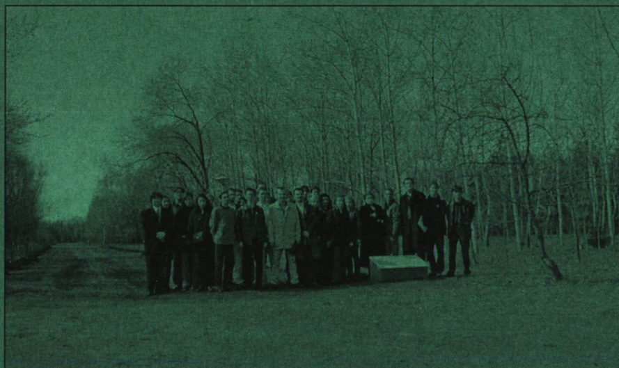
Az EHÖK Választmányának tagjai a fasorban emelt emlékkőnél